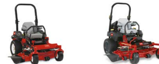
Z SERIE 7000 132 74264TE / 72264TE