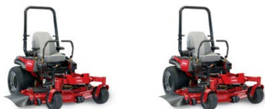
TITAN HD 122 74465TE / 74453TE