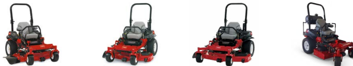
Z SERIE 6000 122 74902TE / 72902TE